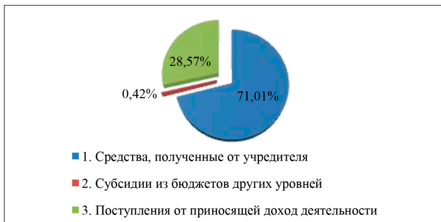
Рис. 1. Структура поступлений средств театров Самарской области за 2023 г. Примечание: составлен авторами на основе табл. 1