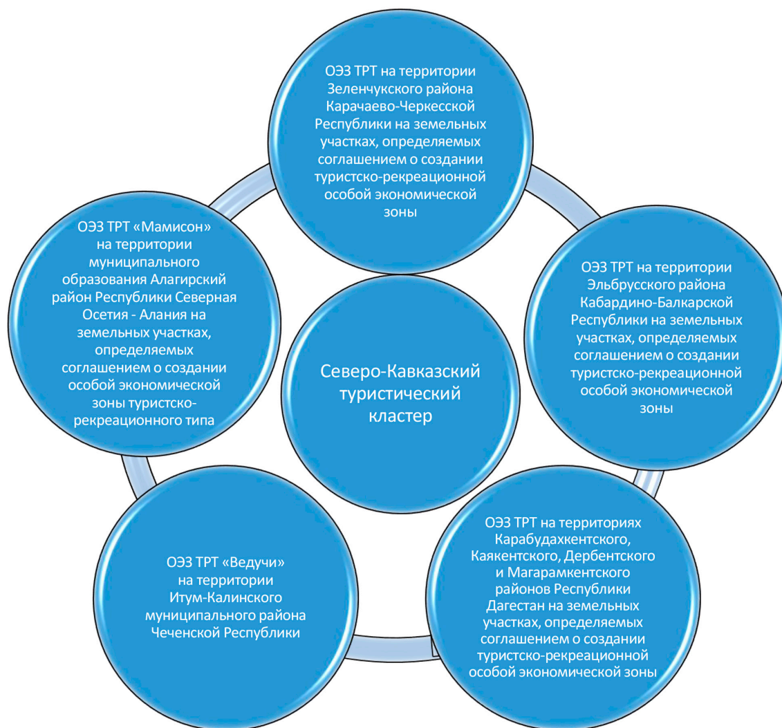
Рис. 1. Структура Северо-Кавказского туристического кластера

Следует отметить, что «пять из десяти особых туристических зон Российской Федерации располагаются в СКФО. Данный факт предполагает, на наш взгляд, приоритетное положение СКФО в стратегии развития туризма в России с учетом туристского потенциала» [8]. На 01.12.2023 года Северо-Кавказский туристический кластер представлен на рисунке 1.