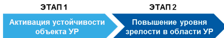
Рис. 3. Этапы работы в области устойчивого развития [15]

Следует отметить, что Российское аналитическое кредитное рейтинговое агентство (АКРА) высоко оценило деятельность Госкорпорации «Росатом» в области устойчивого развития, в ноябре 2022 г. присвоив на оценку ESG-3 (категория ESG-B в области экологии, социальной ответственности и корпоративного управления), что соответствует оценке в «зеленой» зоне. Оценка была весьма подробной. В ней приняты участие пять ключевых дивизионов Росатома.