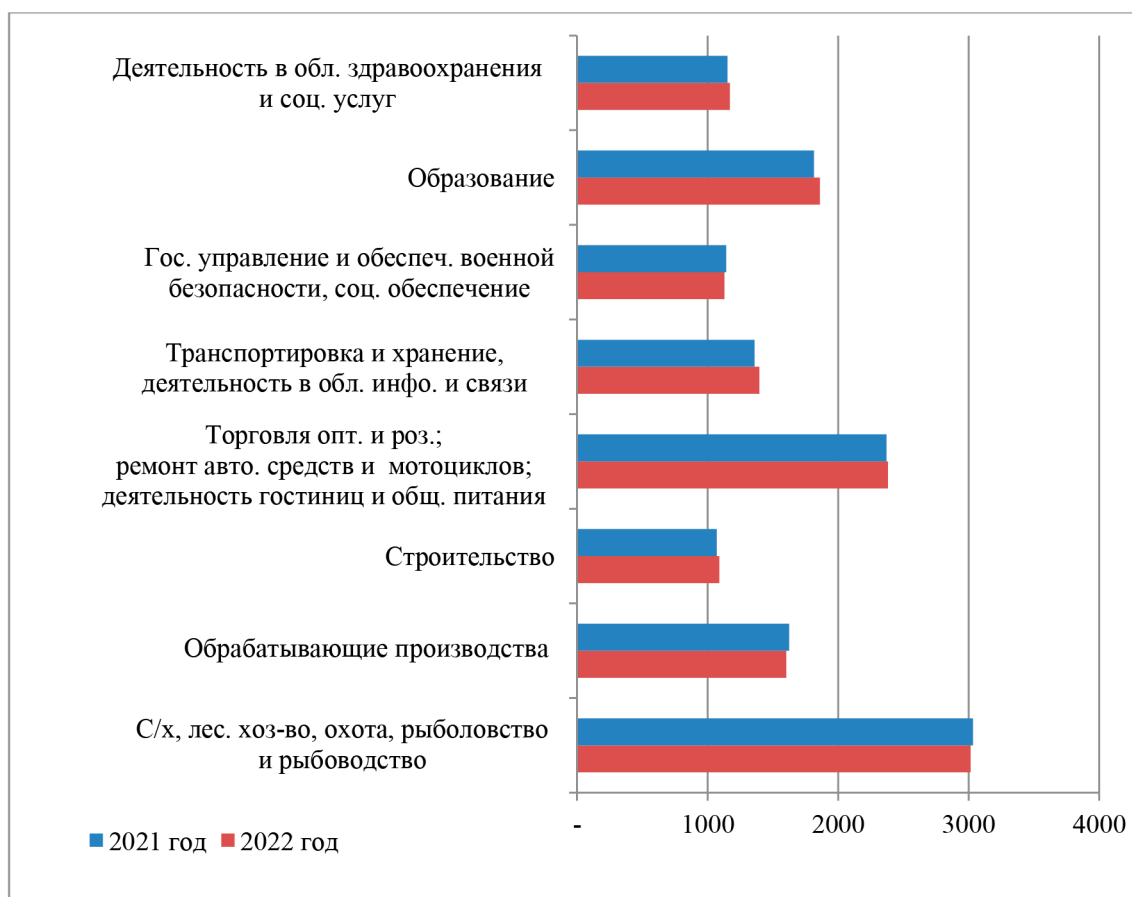
Рис. 2. Занятое сельское население в возрасте 15 лет и старше по видам экономической деятельности на основной работе, тыс. чел.