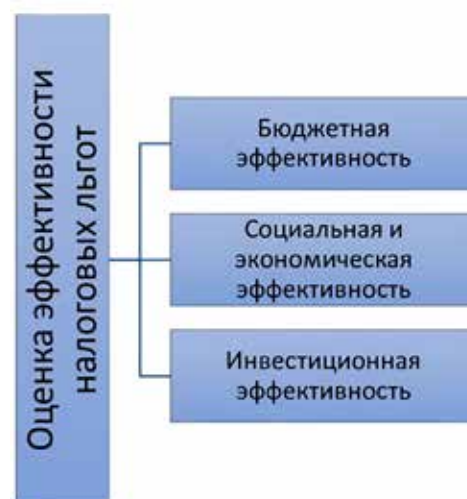
Рис. 2. Усовершенствованная методика оценки эффективности налоговых льгот в отношении региональных и местных налогов (на примере Омского региона)