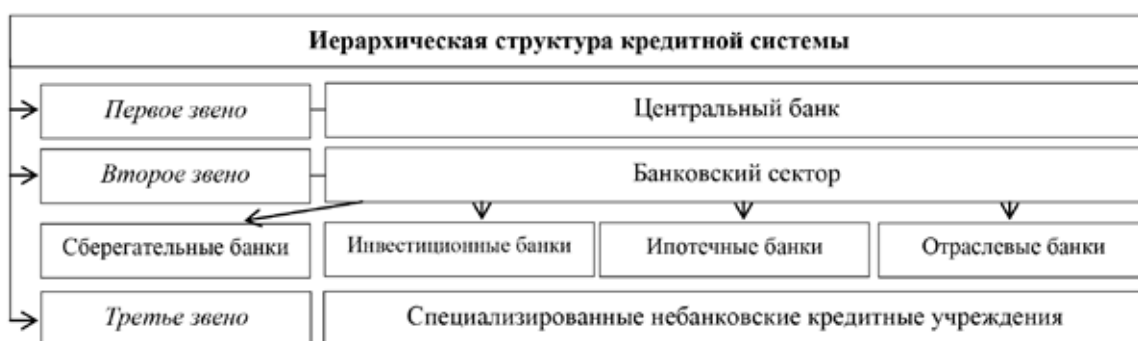
Рис. 3. Структура банковского сектора (2022 г.)

Введенный пакет санкций заставляет Правительство РФ изменить финансовую политику государства. Кроме того, должна быть затронута структура банковского сектора. Она должна стать наиболее сложной, чтобы минимизировать риски ухода с рынка иностранных инвесторов, а также последствия после заморозки российских активов в зарубежных банках. Назрела необходимость внедрить новые финансовые инструменты, чтобы обеспечить благоприятное функционирование банковского сектора в 2024 г. На текущий момент иерархия банковского сектора состоит из двух основных и третьего дополнительного звена (рис. 3) [3].