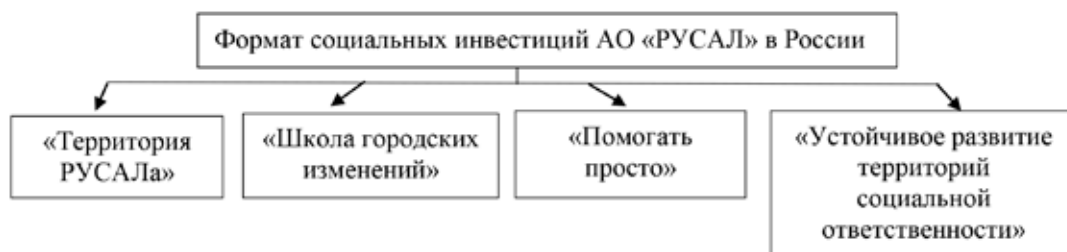
Рис. 5. Четыре формата социальных инвестиций АО «РУСАЛ» в России [10]

Комплексные программы социальных инвестиций реализуются инфраструктурной организацией компании – фондом «Центр социальных программ». При этом фонд, с одной стороны, выступает в качестве ресурсного центра развития местных сообществ и волонтерства, с другой стороны, как финансовый инструмент реализации социальных инфраструктурных проектов.