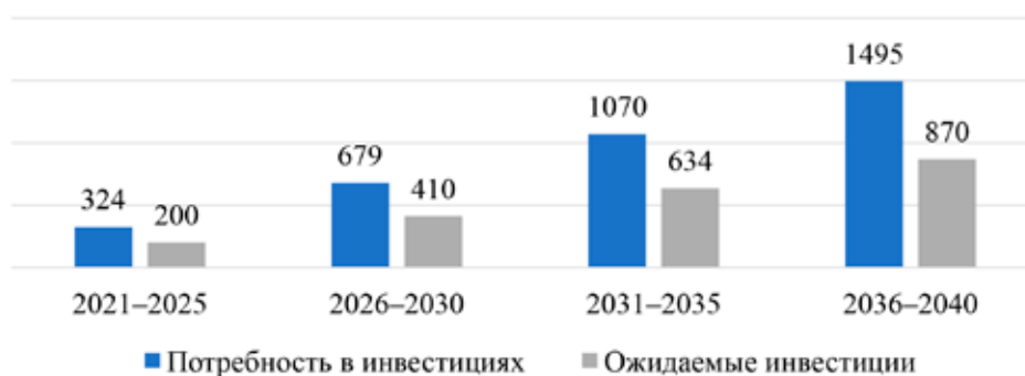
Рис. 3. Динамика инфраструктурных корпоративных инвестиций в России в динамике 2021–2040 гг., млрд долл. [8]