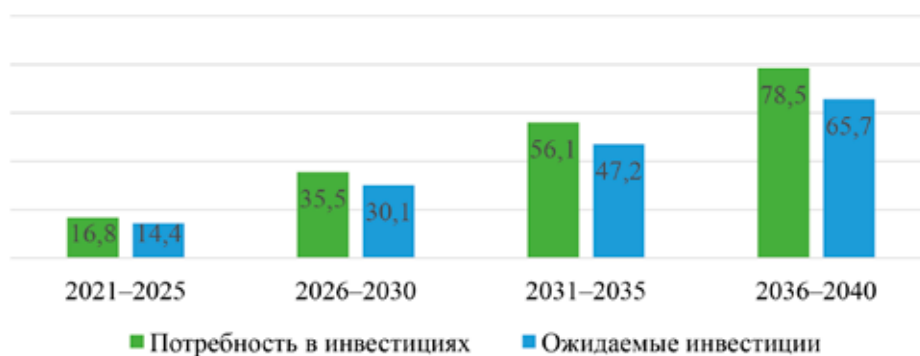
Рис. 1. Динамика инфраструктурных инвестиций в мире в динамике 2021–2040 гг., трлн долл. [8]