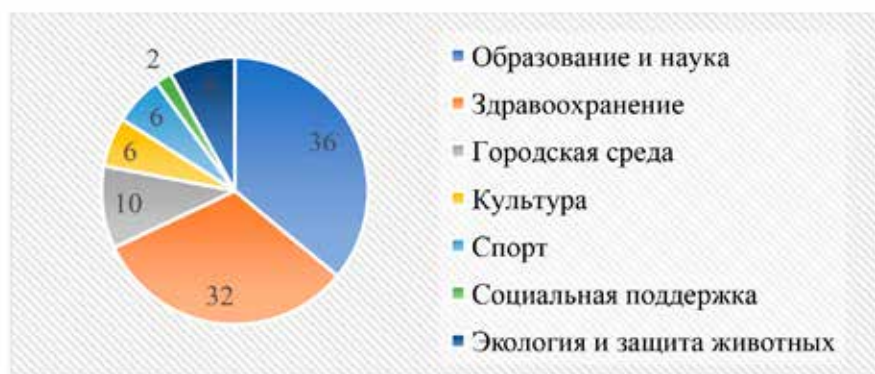
Рис. 6. Структура инвестиций «Устойчивое развитие территорий социальной ответственности» АО «РУСАЛ» в 2021 г., % [10]