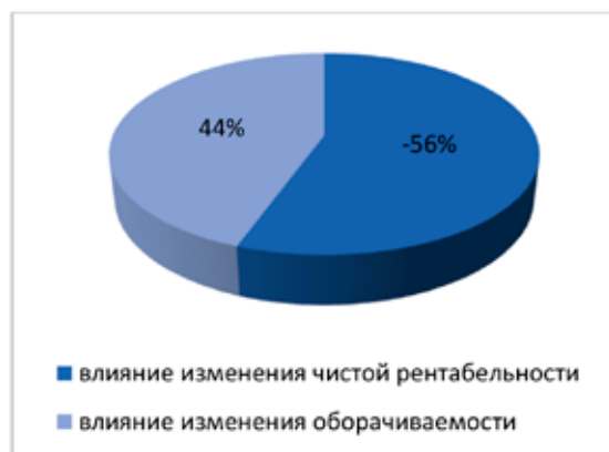
Рис. 2. Влияние факторов на изменение рентабельности активов САО «ВСК» в 2019–2021 гг., % [4]