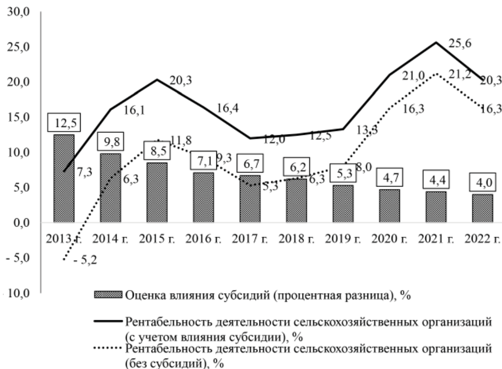
Рис. 1. Оценка влияния объемов государственного субсидирования на рентабельность деятельности сельскохозяйственных организаций России, % [3]

Лишь в 2020 г. после законодательной защиты выделяемых на агрострахование средств, роста объемов государственной поддержки, активного стимулирования региональных властей и сельскохозяйственных организаций к заключению договоров страхования рентабельности деятельности застрахованных сельскохозяйственных товаропроизводителей начала активно расти [5] и составила 21,0% на конец 2020 г., увеличилась еще до 25,6% на конец 2021 г. и снизилась до 20,3% на конец 2022 г.