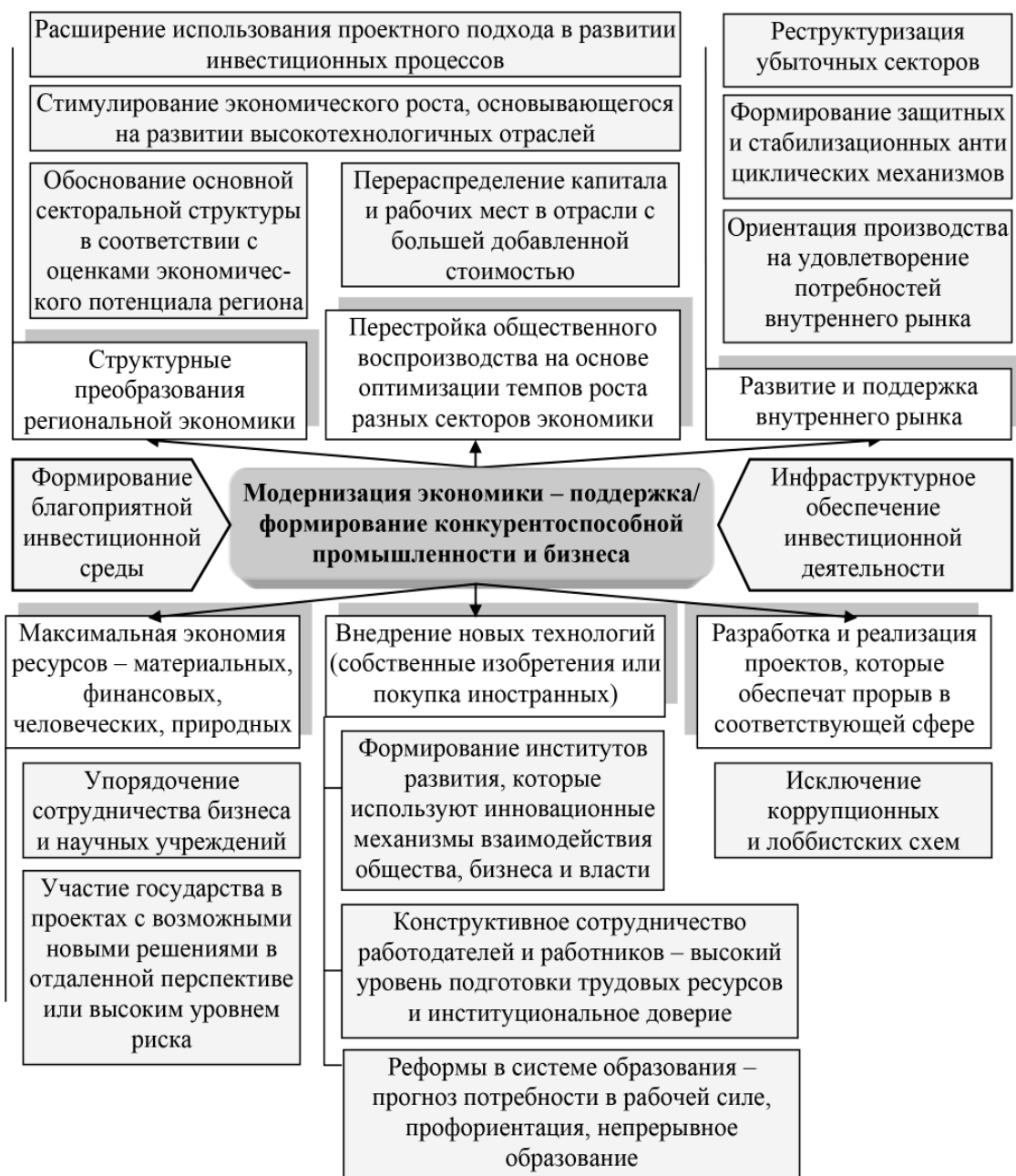
Рис. 1. Составляющие элементы модернизации экономики

На рисунке 1 приведена содержательная составляющая модернизации экономики в контексте обеспечения устойчивой позитивной динамики на основе активизации участия предприятий и всего хозяйственного механизма в целом в региональном, национальном и международном разделении труда.