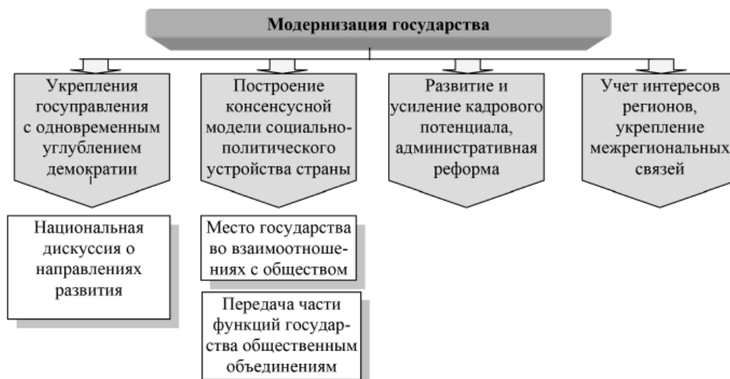
Рис. 2. Организационная схема модернизации государства в рамках проведения социально-экономической модернизации

Залогом успешной модернизации является привлечение к конструктивному сотрудничеству всего общества. Модернизация общественных отношений непосредственно связана с формированием настроенности всего населения на перемены. Без этого, как свидетельствует и мировой, и отечественный опыт, нельзя достичь поставленной цели. Примерами являются программа индустриализации, реализованная в СССР в 1930-х годах, или масштабная модернизация английской экономики, опирающаяся на протестантскую реформацию. В связи с этим представляется, что социальная модернизация должна включать в себя ряд составляющих, представленных на рисунке 3.