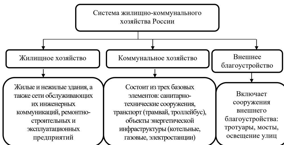
Рис. 1. Общая структура системы жилищно-коммунального хозяйства России

Достижение единства функционирования жилищно-коммунального комплекса происходит путем формирования отлаженных механизмов и процессов, устанавливающих четкие хозяйственные коммуникации и стабильность деятельности инженерных систем. На рис. 2 представлена общая структура коммунальных предприятий России [6].