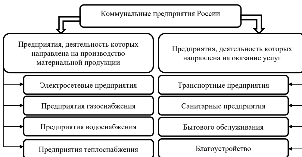
Рис. 2. Общая структура коммунальных предприятий России