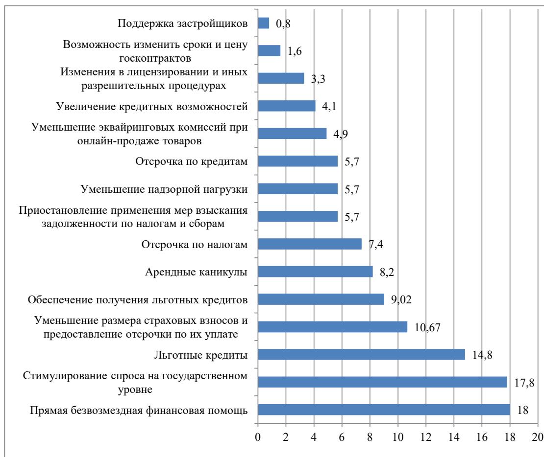
Рис. 3. Мнение респондентов о требуемых мерах поддержки бизнеса, %