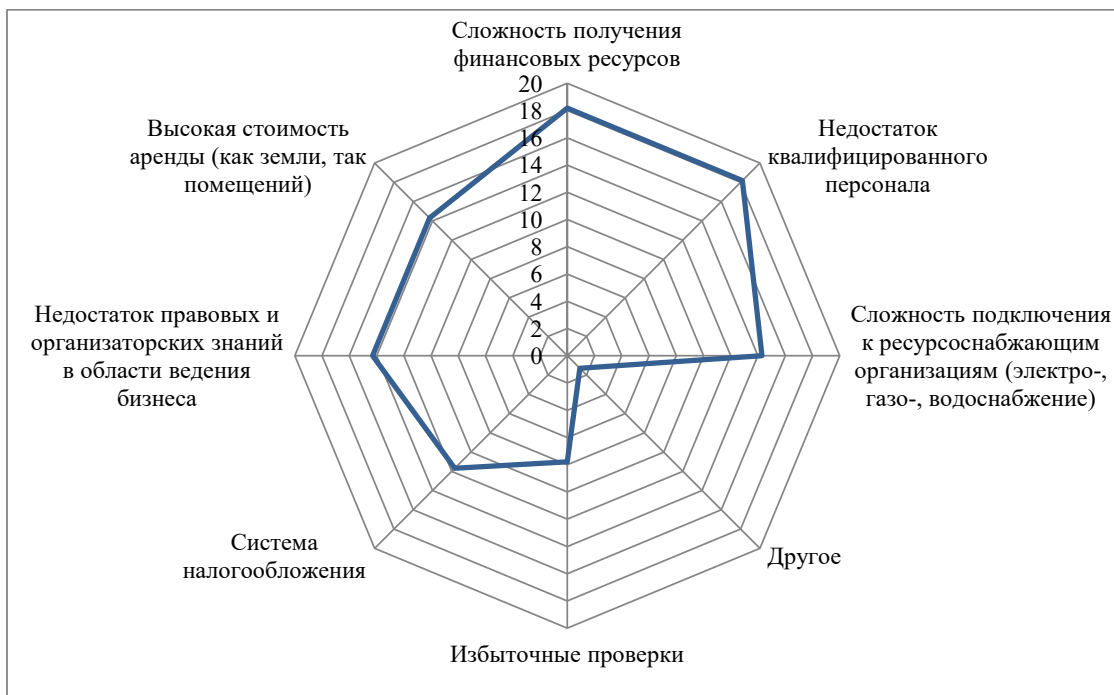
Рис. 2. Причины, препятствующие развитию предпринимательства, %