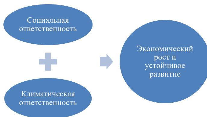
Рис. 2. Элементы устойчивого развития (трехединый подход)

3. Трехединый подход. К концу XX в. появился запрос на кардинальную трансформацию концепции устойчивого развития. Драйвером выступил все тот же ООН. В 1992 г. в Бразилии состоялся «Саммит Земли», где впервые утвердили термин «устойчивое развитие» [3]. По результатам конференции был опубликован стратегический доклад «Повестка дня на XXI век», где на участников была возложена ответственность по решению насущных климатических вопросов. Были юридически закреплены стратегические цели и план мероприятий по реализации принятых принципов устойчивого развития. Впервые появилась некая единая тройственная теория устойчивого развития, состоящая из базовых элементов: социальной и климатической ответственности, синергия которых позволит достичь необходимого экономического роста (рис. 2).