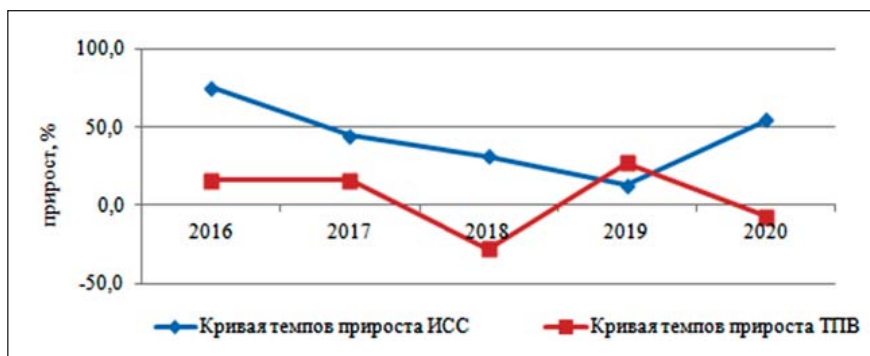
Рис. 2. Кривые темпов прироста ИСС и ТПВ