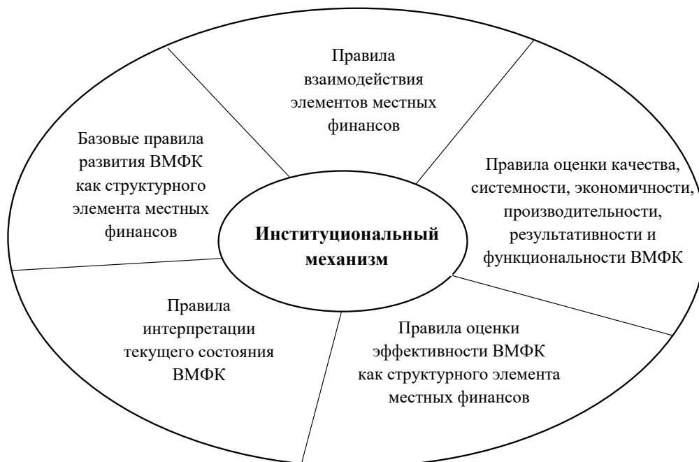
Рис. 1. Институциональный механизм совершенствования ВМФК

В целях повышения эффективности ВМФК определены научно-практические рекомендации по использованию авторского институционального механизма его совершенствования.