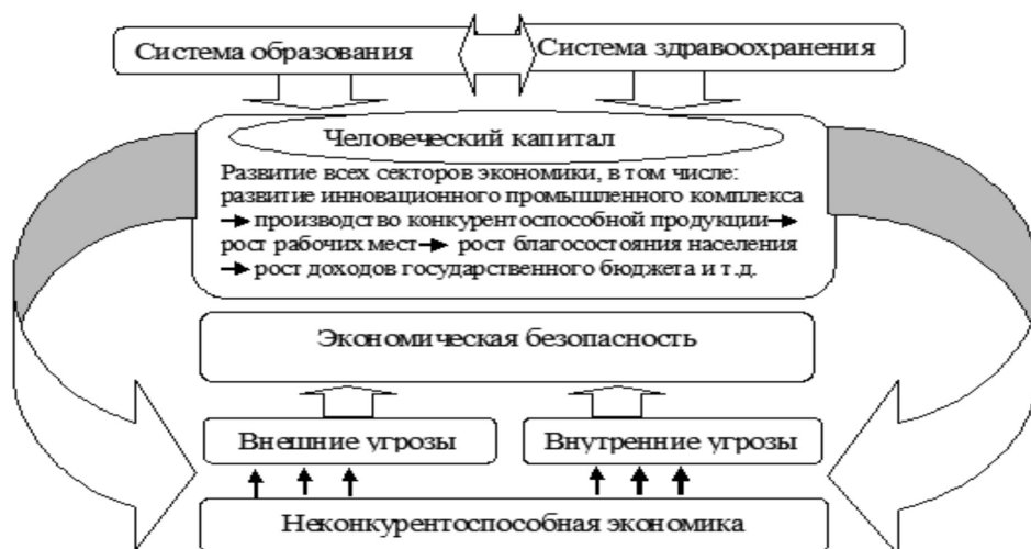
Рис. 2. Схема влияния человеческого капитала на угрозы экономической безопасности [Составлено автором]