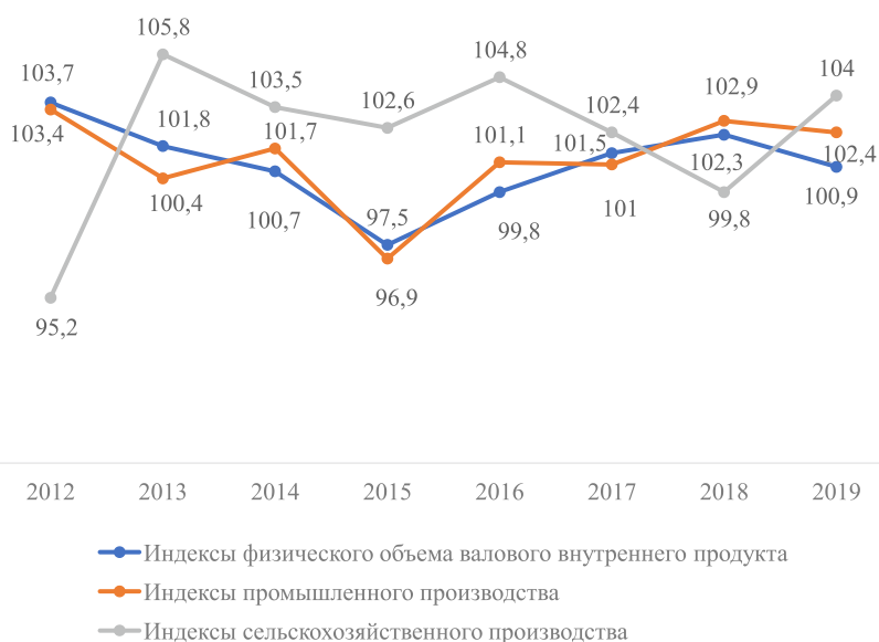
Рис. 2. Темпы роста ВВП, промышленного и сельскохозяйственного производства (% к предыдущему году, в сопоставимых ценах) [16]