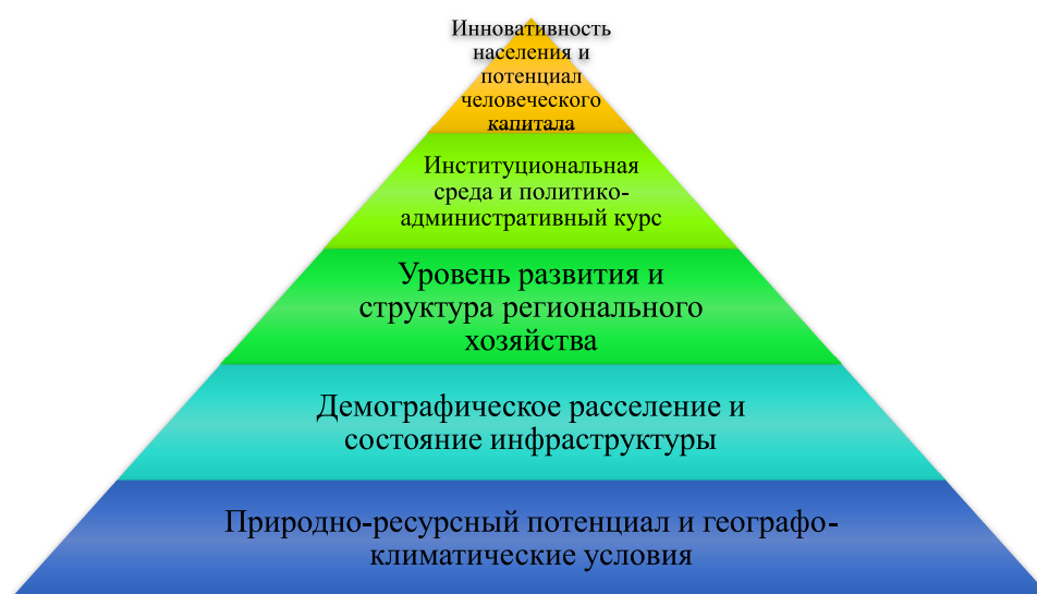
Рис. 2. Пирамида факторов и условий экономического и бюджетного регионального развития

В развитии региональных социально-экономических систем возможны ситуации, при которых субъект страны, имеющий статус устойчивого с точки зрения бюджетного состояния, может под воздействием определенной группы перечисленных факторов перейти в состояние отсталости и депрессивности. Поэтому с точки зрения федеральной региональной политики ключевым аспектом разработки стратегий развития территорий и минимизации уровня дотационности является не только сведение акцентов к стимулированию эффективности работы органов региональной власти, но и учет всего многообразия объективных факторов, которые могут доминировать в определении траектории развития субъекта страны на каждом временном этапе.