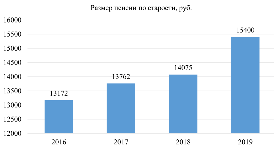
Рис. 2. Динамика среднегодовой страховой пенсии по старости за 2016–2019 гг. Примечание: составлено авторами на основе [5, 7, 10]

Ещё одним немаловажным и значительным аспектом в рамках рассматриваемой темы является количество пенсионеров, получающих государственную экономическую и социальную поддержку в виде выплат в связи с достигнутым возрастом. Логическая тенденция увеличения таковых граждан не может не повлиять на макроэкономическую политику государства и постепенно снижает экономический потенциал страны как единого целого, что зачастую может объяснить микрокризисы внутри России. Так, в 2017 г. страховые пенсии по старости получили 36 млн 311 тыс. человек, что превышает аналогичный показатель предшествующего года на 0,84%. Примечательно, что количество женщин-пенсионерок, согласно Росстату, в два раза превышает количество мужчин-пенсионеров. Более подробная статистика представлена на рис. 3.