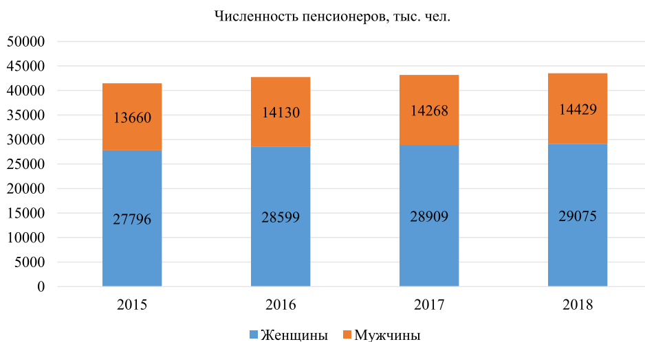
Рис. 3. Распределение численности пенсионеров по полу за 2015–2018 гг. Примечание: составлено автором на основе [11]