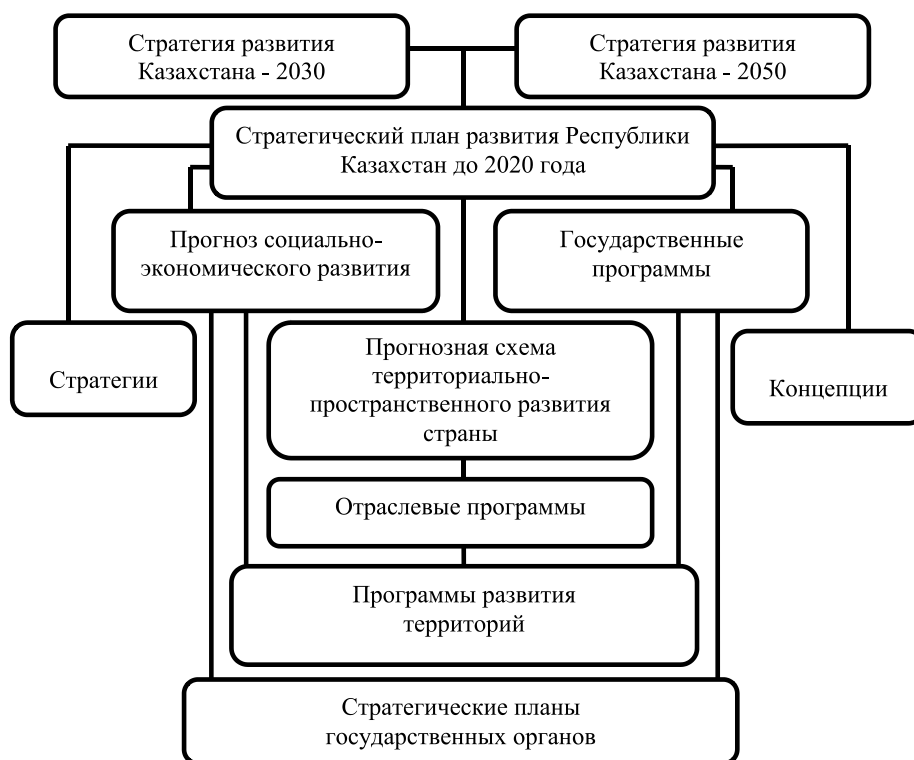
Рис. 2. Модель иерархичной структуры метастратегий РК

В качестве методологической основы использованы аспектные исследования, наблюдение и анализ документальной информации, формализация и системный подход с учетом принципа иерархичности, структуризации и непрерывного изменения. Авторы уже обращались к вопросу развития стратегического планирования [2]. На основе собранного материала авторами проведен вертикальный анализ иерархической структуры функционирующих государственных программ стратегического назначения в Республике Казахстан, при этом учтены развивающиеся интеграционные процессы и кризисные явления, изучена модель формирования метастратегии. На рис. 2 представлена модель иерархичной структуры метастратегий Республики Казахстан [3–5]. В ходе нового исследования особое внимание уделено совершенствованию отдельных компонентов национальной системы стратегического управления, алгоритмам адаптации метастратегии, мониторингу достижения ключевых показателей.