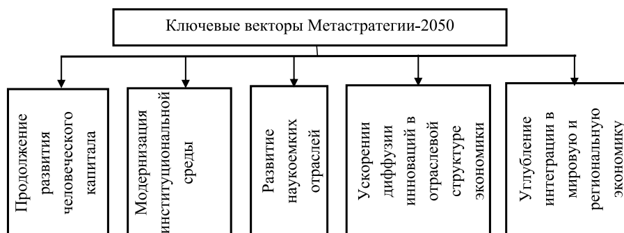
Рис. 4. Ключевые направления Метастратегии – 2050

В целях реализации Метастратегии развития до 2050 г. и поручений Главы государства была разработана стратегическая модель вхождения Казахстана в число 30 самых прогрессивных государств мира (Концепция – 2050) [7]. На рис. 4 показаны драйверы Метастратегии развития до 2050, основным из которых является интеллектуальный капитал страны. Совершенствование институциональной среды должно быть направлено на создание условий для формирования наукоемкой модели экономического развития.