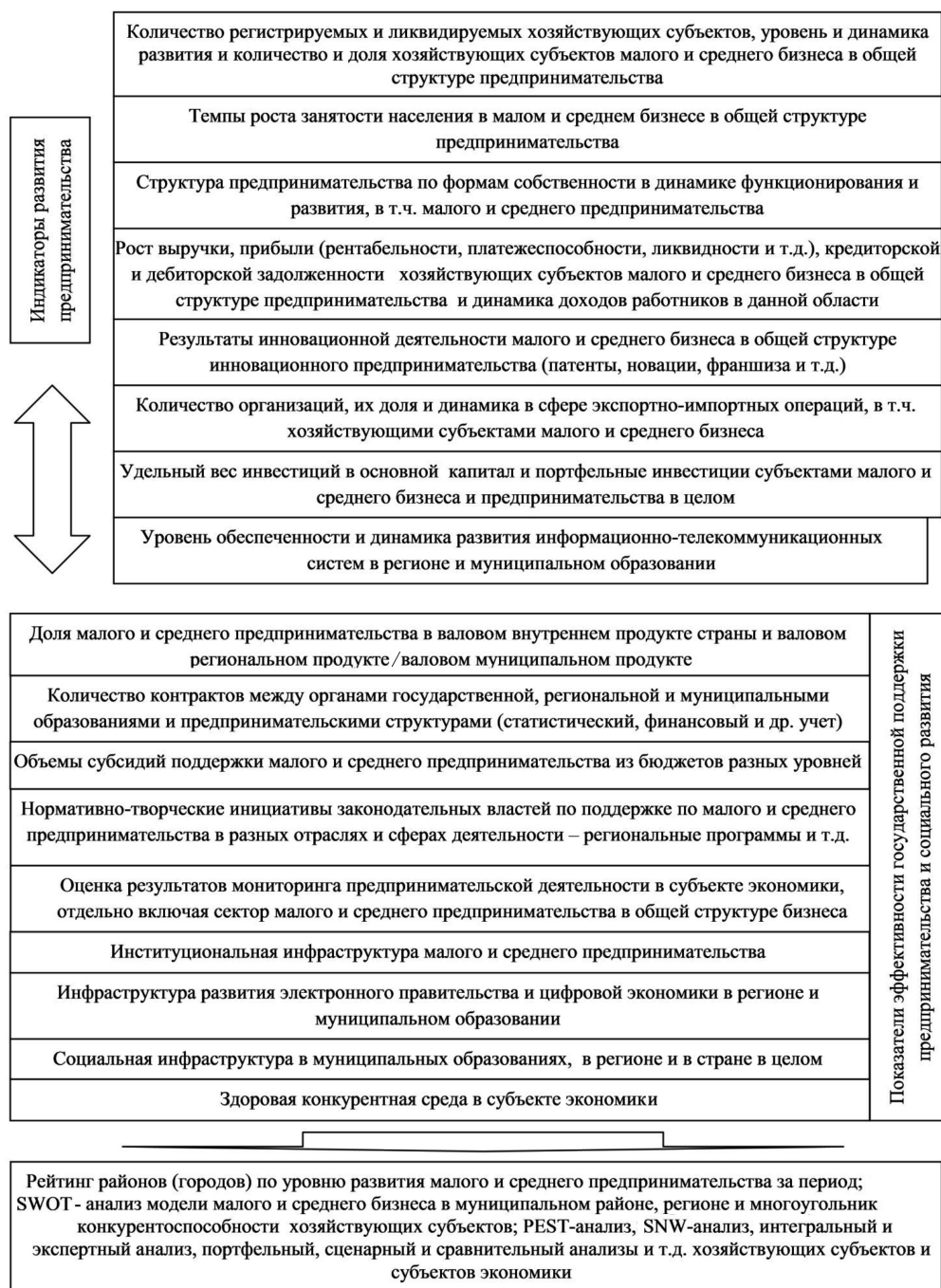
Рис. 2. Система индикаторов и основных показателей социально-экономического развития региона

Социально-экономическое прогнозирование является важным элементом формирования целостной системы управления национальной экономики и территории. Экономическая политика государства выражается в определении степени и методов воздействия на все субъекты рыночных отношений. Рыночные механизмы, направленные на эффективную и результативную