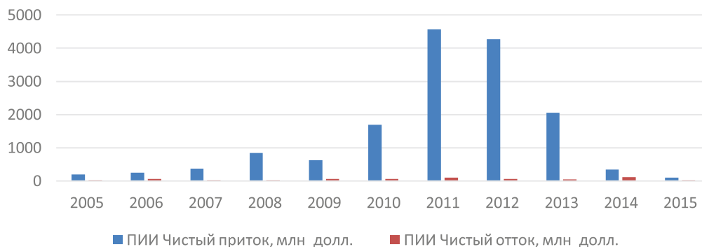
Рис. 4. Динамика прямых иностранных инвестиций в Монголию (чистый приток и чистый отток) за 2005–2015 гг.