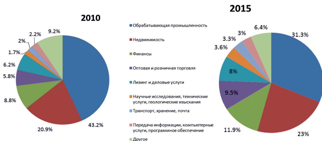
Рис. 3. Структура ПИИ в Китае за 2010 и 2015 гг., %

В структуре ПИИ Китая за анализируемый период произошли достаточно резкие структурные сдвиги; сократились прямые иностранные вложения во вторичный сектор при существенном увеличении доли инвестиционных сделок в недвижимости, торговле, транспорте и телекоммуникациях (рис. 3).