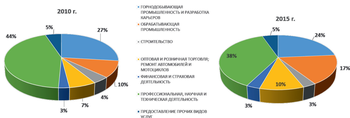
Рис. 7. Структура ПИИ в Казахстане (чистый приток) за 2010 и 2015 гг., %