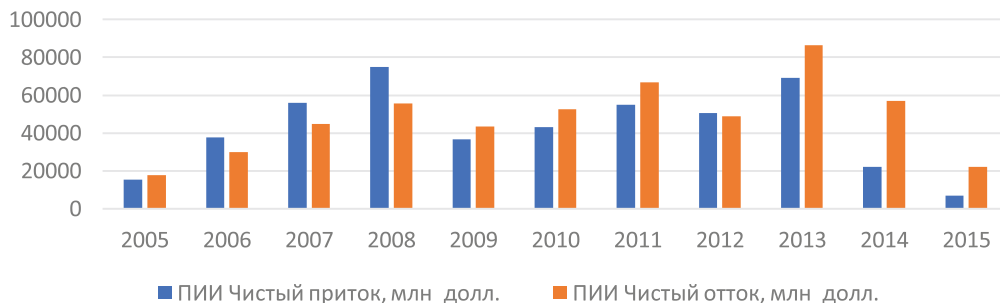
Рис. 1. Динамика прямых иностранных инвестиций в Россию (чистый приток и чистый отток) за 2005–2015 гг.

В списке современных инвесторов России Кипр, Британские Виргинские острова, Багамы и др., имеющие офшорное происхождение. Без учета офшоров в число основных стран-инвесторов в общий приток ПИИ в Россию входят Нидерланды, Люксембург, Германия, Великобритания, Швейцария, Австрия. Нидерланды не являются офшором, но часто используется российскими холдингами для создания материнских компаний, это связано с удобством законодательства и прозрачностью правовой системы страны. Поэтому регистрируются компании специального назначения (SPV) при реализации схем проектного финансирования. Определенные закономерности свидетельствуют о том, что активы России сосредоточены сейчас в производстве электроэнергии, нефтегазодобыче, добыче янтаря, урана и алмазов, а также в нефтепереработке, транспортном машиностроении и атомной промышленности. В остальных отраслях государство уже не играет заметной роли. Следует отметить также, что сырьевая зависимость страны проходит в условиях снижения уровня диверсификации экономики России.