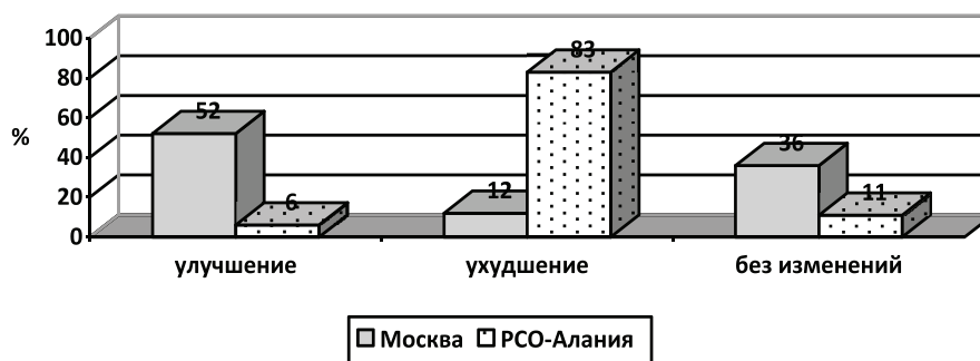
Рис. 3. Изменение экономического положения респондентов за период 2014–2017 гг.

Положение с материальным положением населения России за последние годы остается весьма сложным и неоднозначным [10]. Если в 2014 г. денег не хватало даже на продукты питания 29% населения, то в 2017 г. – уже 38%. При этом, одновременно, приобрести автомобиль на свои