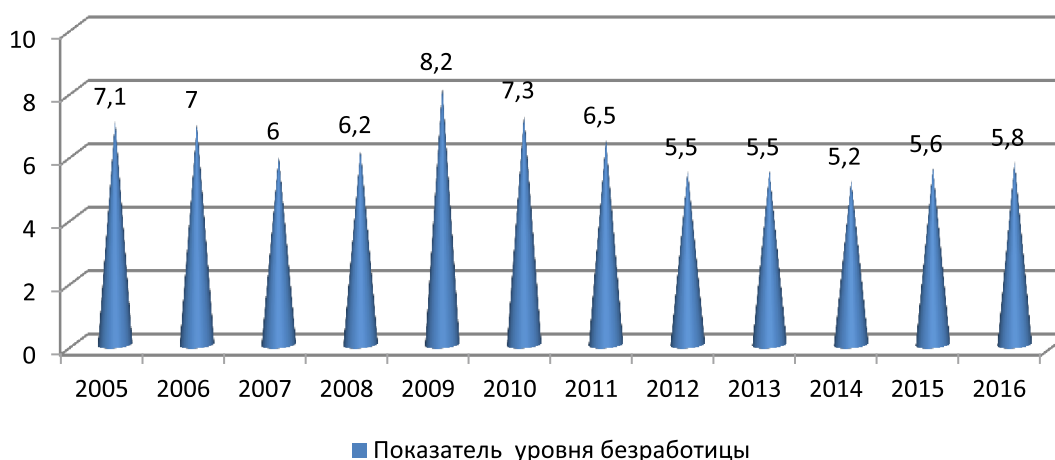
Рис. 1. Диаграмма показателя уровня безработицы за 2005–2016 гг. по РФ, в %

Примечание.