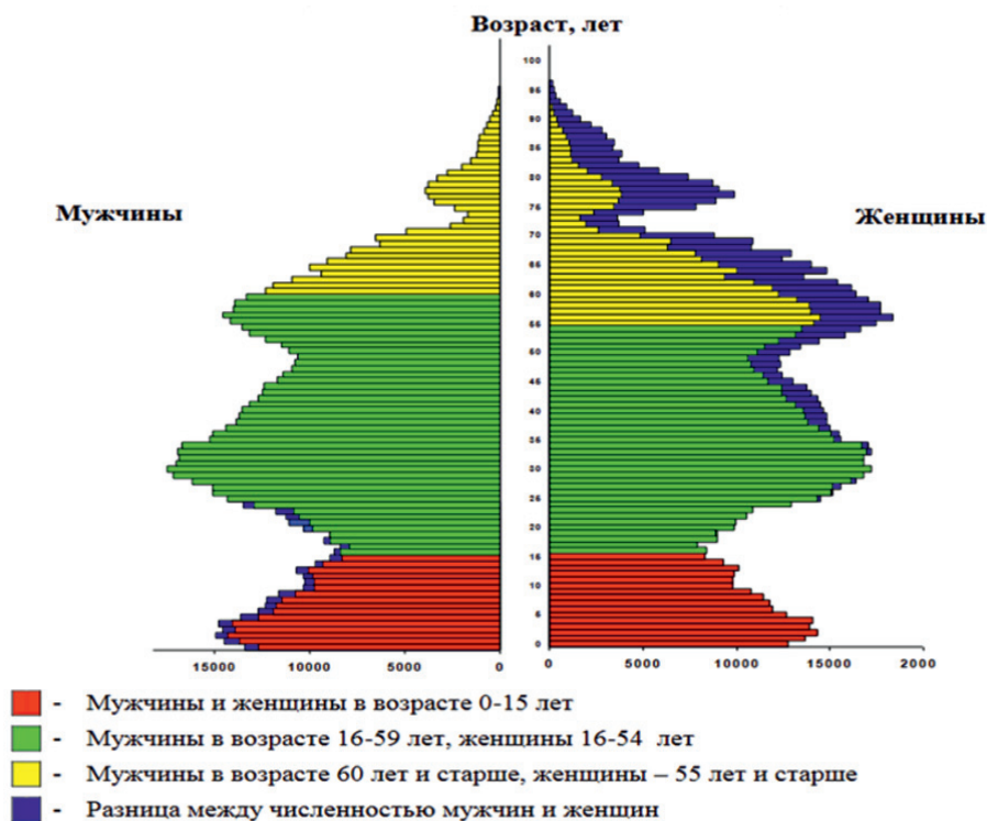
Рис. 2. Структура населения Омской области