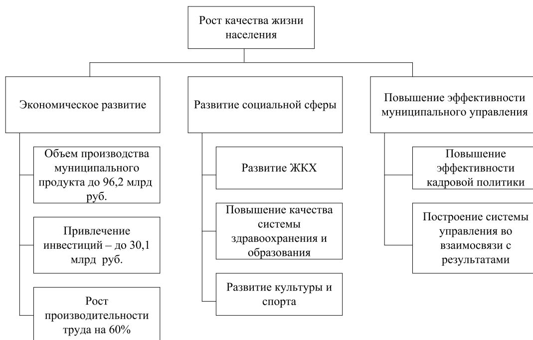
Рис. 3. Дерево целей стратегического развития Ростовской области до 2020 г.