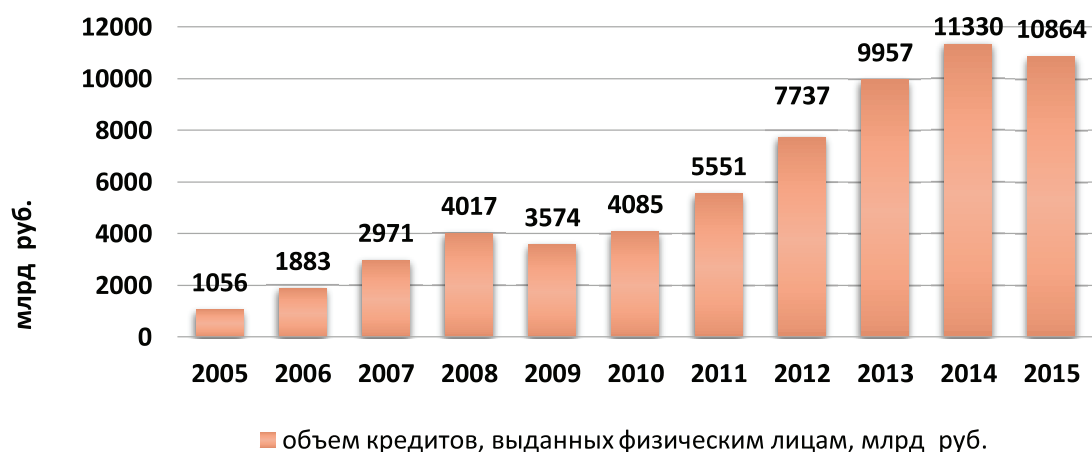
Рис. 3. Динамика объемов потребительского кредитования в России в 2005–2015 гг.

В 2007 г. приток иностранного капитала в Россию достиг пика – 7% от ВВП (для сравнения, в 1999 г. отток капитала составлял 11% ВВП). Согласно оценке Экономической экспертной группы повышение цены на нефть на 1 долл/барр. увеличивало чистый приток капитала на 1 млрд долл. [2, с. 10]. Приток капитала извне способствовал росту масштабов кредитования. Реальная величина кредитов физическим лицам в период 2000–2008 гг. росла в среднем на 53% в год или в 46 раз (рис. 3).