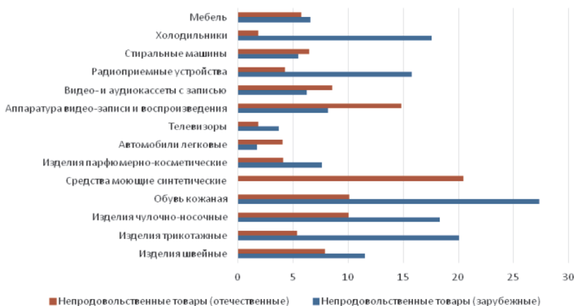
Рис. 3. Квадратический коэффициент «абсолютных» структурных сдвигов по качеству непродовольственных товаров российского и зарубежного производства

Расчет и анализ квадратического коэффициента «абсолютных» структурных сдвигов по качеству непродовольственных товаров российского и зарубежного производства (рис. 3) позволил выявить неустойчивость качества непродовольственных товаров, реализуемых на российском рынке.