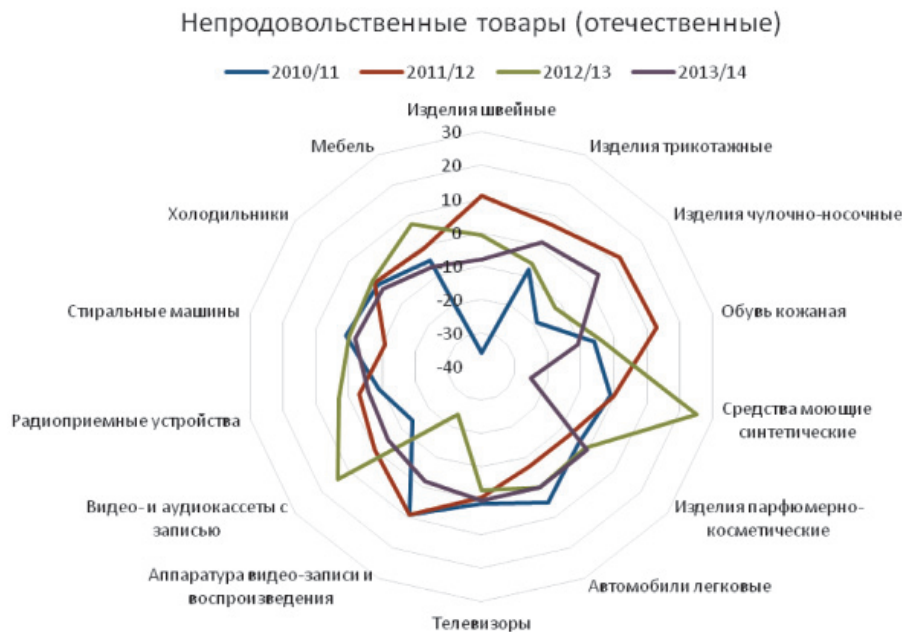
Рис. 1. Масса структурных сдвигов по качеству непродовольственных товаров российского производства

Масса структурных сдвигов по качеству непродовольственных товаров, реализуемых на российском рынке, в большей степени характеризуется отрицательным значением, что для исследуемого показателя является положительной тенденцией (рис. 1 и 2).