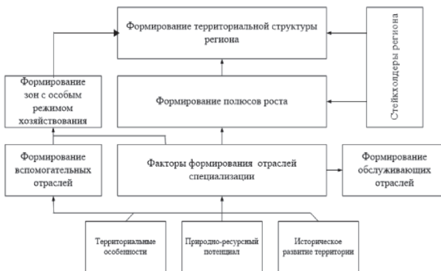
Рис. 2. Изменения в структуре экономического пространства

выделить отрасли специализации, доля которых в пределах данной территории выше средних показателей по стране. Кроме этого, можно выделить отрасли с более высоким уровнем динамики, доля которых в экономике территории ниже среднего показателя по стране (прорывные отрасли). Отрасли специализации могут быть обусловлены территориальными особенностями, природно-ресурсным потенциалом или вытекать из исторического развития территории (рис. 2).