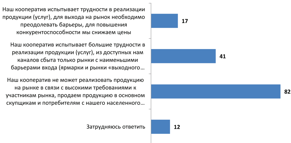
Рис. 3. Характеристика функционирования сельскохозяйственных потребительских кооперативов в условиях конкуренции, авторская разработка

В качестве проблем, которые ограничивают развитие некоммерческих сельскохозяйственных организаций преобладает нехватка ресурсов, в том числе и финансовых (81,6% опрошенных), проблемы сбыта и низкие цены на сельхозпродукцию и сырье (93,4% респондентов), отсутствие (слабая помощь) со стороны государства (54,6% представителей кооперативов), недостаток квалифицированных кадров и необходимой информации, проблемы ведения учета (около 40% опрошенных), давление со стороны контролирующих органов и иные административные барьеры развития (17,8% респондентов), несовершенство нормативно-правовой базы (10,5% представителей кооперативов).