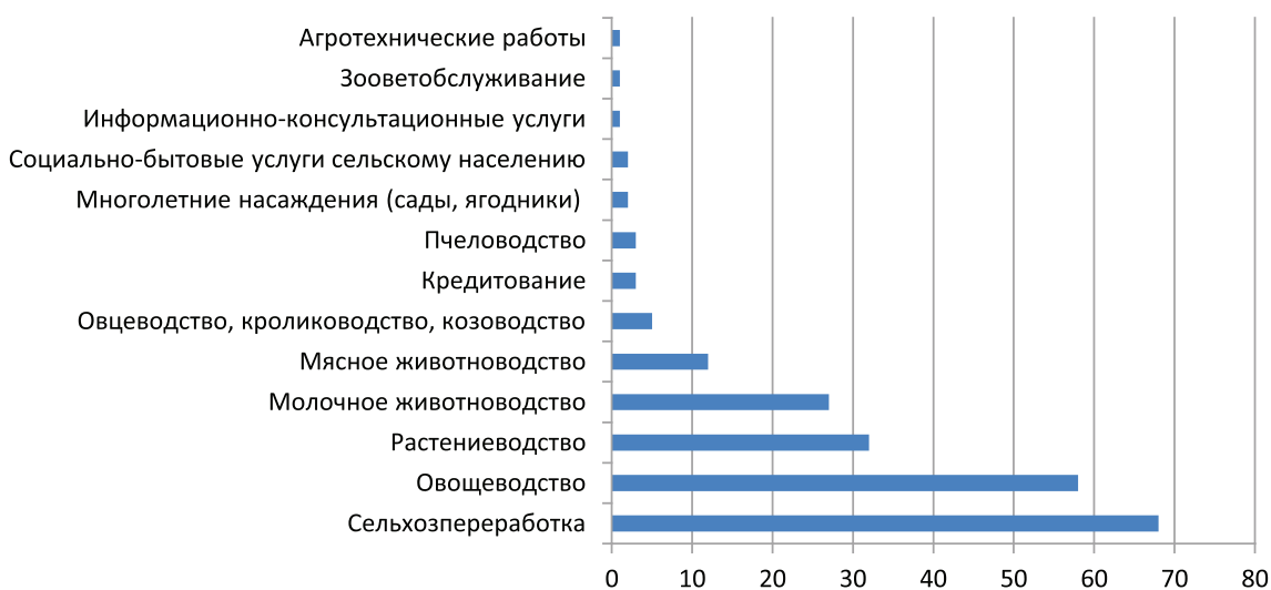
Рис. 2. Основные виды деятельности сельскохозяйственных потребительских кооперативов, авторская разработка