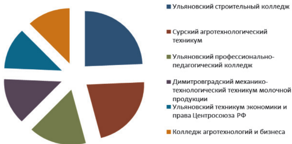
Рис. 2. Количество нетрудоустроенных выпускников сузов г. Ульяновска и Ульяновской области

область, Республика Мордовия. Также покинули пределы области в 2015 г. в целях трудоустройства 122 человека, окончивших службу по призыву в Вооруженных Силах РФ.