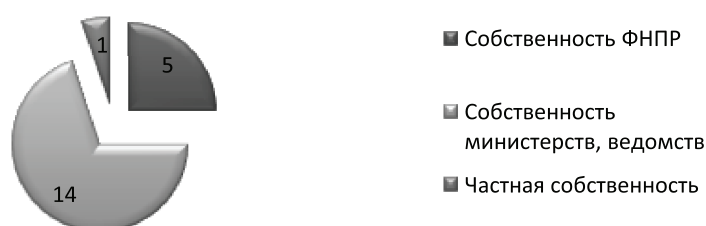
Рис. 2. Распределение санаторно-курортных учреждений по формам собственности