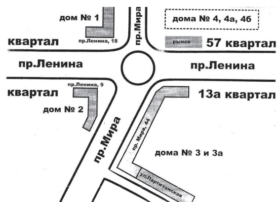
Рис. 2. Пл. Metallургов

Наступает третий этап застройки. На пл. Metallургов три угла застроены 5-этажными зданиями. На четвертом углу планировалось строительство здания (вернее 3-х зданий) в 5–9–12 этажей. С одной стороны, здания выбиваются из общего ансамбля. С другой стороны, они будут «доминирующим и венчающим акцентом пр. Мира». Но третий этап застройки не был завершён. В 1993 году на четвертом углу на том месте, где должен был быть комплекс жилых зданий, украшающий пл. Metallургов, появились три торговых павильона. Постановлением № 867 от 15.07.1993 было утверждено Временное положение по установке торговых киосков и павильонов на территории Комсомольска (рис. 2).