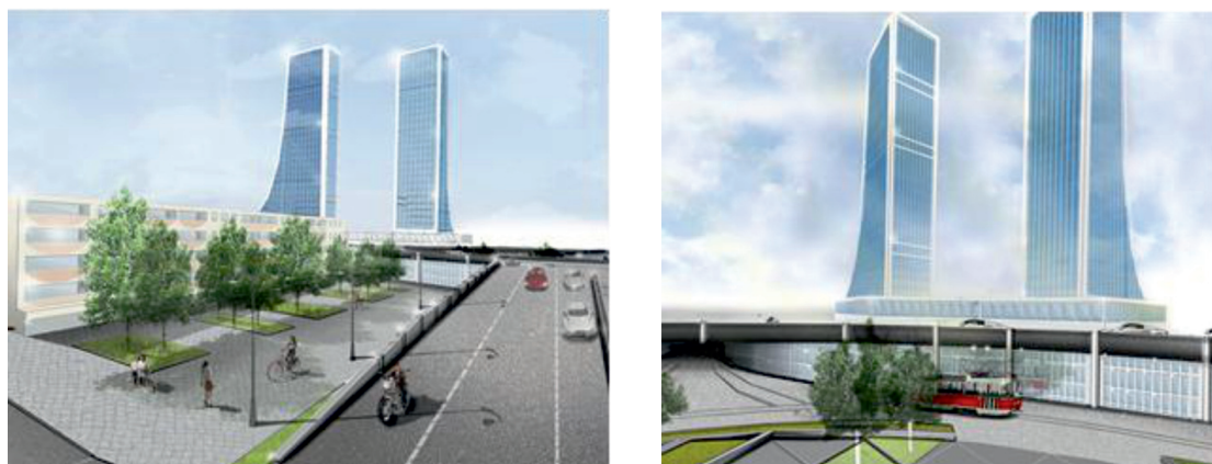
Рис. 4. Экстерьерные изображения пл. Metallurgov

Каждое архитектурное решение в структуре пл. Metallurgov является функционально самостоятельным звеном, а разработанные объекты неотъемлемо связаны друг с другом. Условия размещения всех зон предопределило архитектурно-композиционное решение внешнего вида пл. Metallurgov. Замкнутое в кольцевой автомобильной трассе, размещение визуального центра обеспечивает развитие всего архитектурного комплекса площади. Концептуальная разработка многоуровневого торгово-пешеходного пространства в структуре пл. Metallurgov будет положительно влиять и притягивать внимание жителей города, создаст удобный и привлекательный участок городской среды. Таким образом, все разработанные объекты позволяют гармонизировать пространство современного города. Совокупность разработанных объектов направлена на эффективную работу элементов данной системы, для улучшения жизни горожан Комсомольска-на-Амуре.