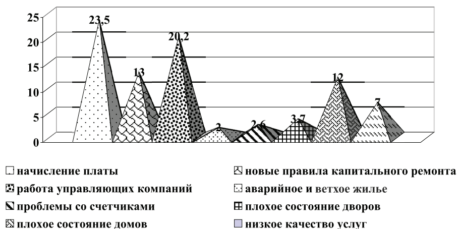
Рис. 1. Основные проблемы ЖКХ с точки зрения населения, % [7]

Увидев сформировавшиеся свалки, население начинает сетовать на чиновников, которые допустили скопление мусора, и на коммунальные службы, которые его не убирают. Но ведь чисто не там, где часто убирают, а там, где не сорят. Поэтому роль воспитания социально-адаптивного, культурного человека, понимающего и осознающего все последствия своих поступков, возрастает в современных условиях. К сожалению, примеры бескультурного поведения граждан во всех сферах жизнедеятельности общества встречаются часто. Важно осознавать, что с каждой выброшенной бутылкой или бумажкой не только наносится урон экологии, истощается почва, отравляется воздух гниющими свалками, но и тратятся собственные денежные средства граждан, полученные посредством налоговых отчислений в бюджет, на уборку и вывоз мусора. Отметим, что в настоящее время практически в каждом регионе России рассматривают новые законопроекты, позволяющие ввести дополнительный налог на вывоз и утилизацию мусора, что еще больше повлияет на финансы каждой семьи или отдельного человека.