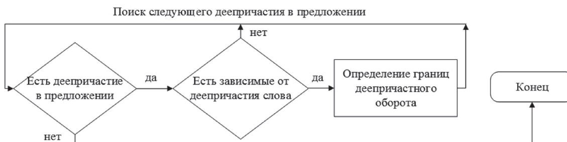
Рис. 3. Блок-схема алгоритма автоматического выделения интонации пояснения в деепричастных оборотах

Для выделения деепричастных оборотов используется аналогичный алгоритм, отличающийся нечувствительностью к местоположению деепричастия к определяемому слову. Блок-схема алгоритма выделения деепричастного оборота представлена на рис. 3.