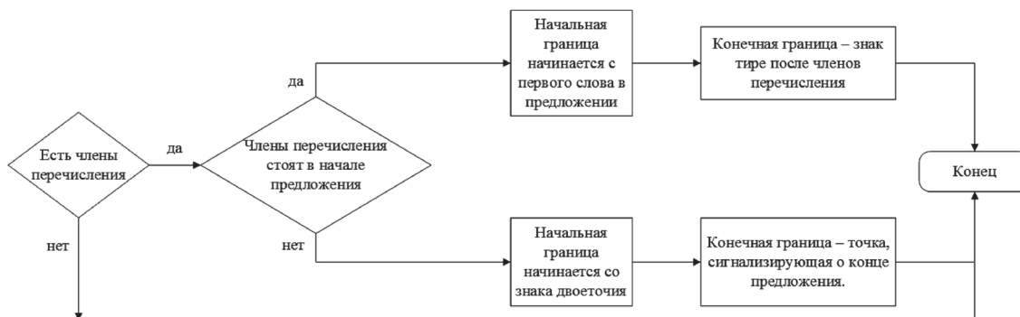
Рис. 5. Блок-схема алгоритма автоматического выделения интонации перечисления в тексте

И жнивья <break time=»t1»/> и дорога <break time=»t2»/> и воздух – все вокруг сияло. (Бунин).