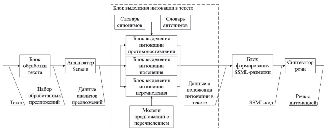
Рис. 1. Структурная схема системы выделения интонации при синтезе речи

В данной работе рассмотрен вопрос автоматического выделения интонации пояснения, перечисления и противопоставления на основе данных морфологического и синтаксического анализа предложения. В качестве анализатора текста используется семантико-синтаксический анализатор Semsin [4]. Рассматриваемые алгоритмы применялись для разметки исходного текста с помощью специальных маркеров – тэгов. Примеры приведены в международном формате языка SSML, позволяющего изменять тон, скорость и громкость произношения и ставить паузы.