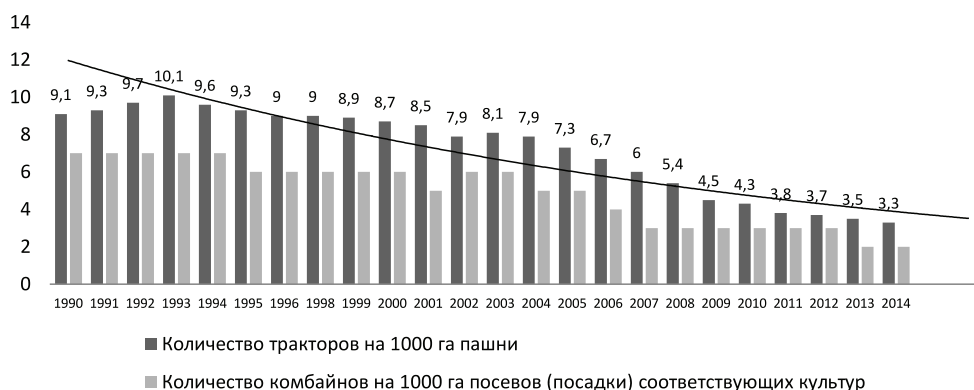
Рис. 2. Динамика обеспеченности сельхозтехникой отрасли Республики Башкортостан в 1990–2014 гг.