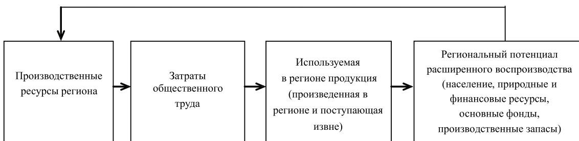
Рис. 2. Цепочка воспроизводственного цикла

Основу формирования производственного потенциала региона (рабочей силы, средств и предметов труда) составляют: население, природные и финансовые ресурсы, основные фонды, производственные запасы, которые могут рассматриваться как конечный результат РВ, т.к. они совпадают, вообще говоря, с национальным богатством в широком смысле. На следующем этапе воспроизводства производственных ресурсов они уже вовлекаются в производственный процесс, тем самым начав новый цикл воспроизводства производственных ресурсов. Таким образом, воспроизводственный цикл образует цепочку.