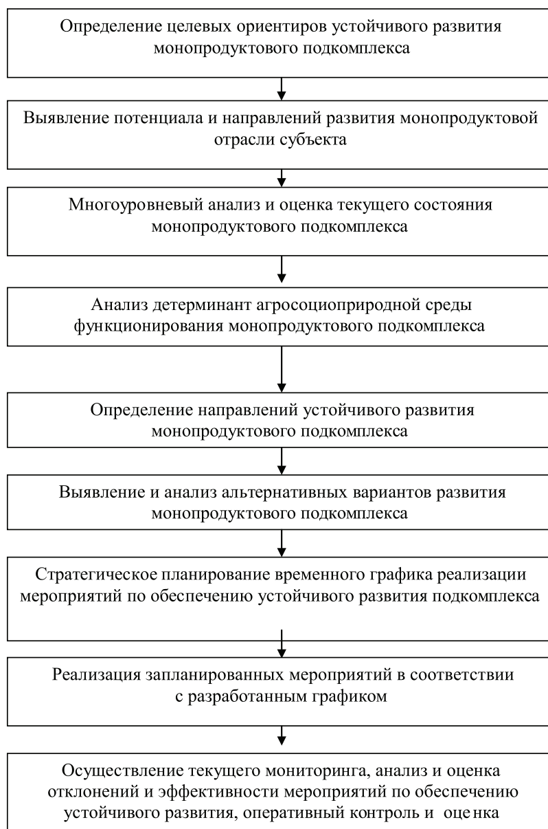
Рис. 2. Этапы аналитических процедур при разработке платформы устойчивого развития

Одним из важнейших и имеющих важнейшее информационное значение экономических параметров, характеризующих уровень развития и результативность функционирования субъекта анализа, является эффективность его деятельности. Теорией и практикой экономического анализа разработано множество трактовок данной категории, отражающих различия в методологических подходах к ее изучению и толкованию [3].