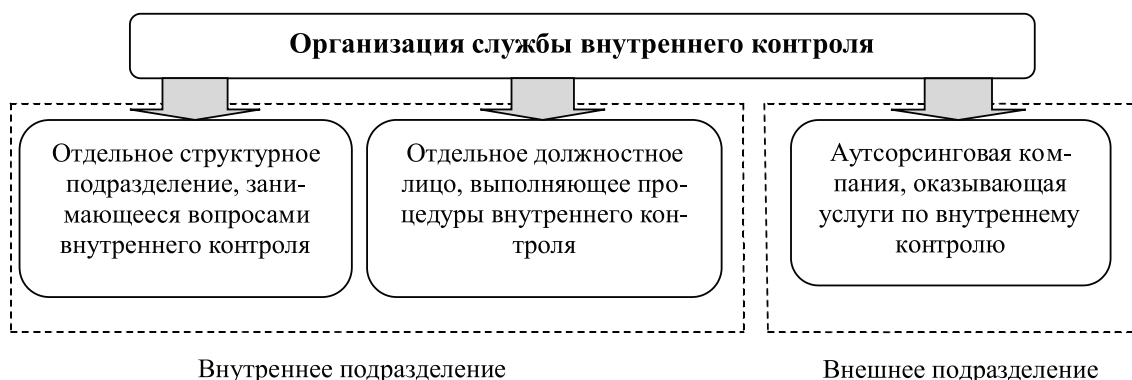
Рис. 1. Варианты создания службы внутреннего контроля в сельскохозяйственных организациях

Обеспечить внутренний контроль возможно также с помощью специализированной организации – аутсорсинговой компании, с которой необходимо заключить соответствующий договор на оказание такого рода услуг. Перечень функций и их объем будет определен в договоре на оказание услуг по осуществлению внутреннего контроля.