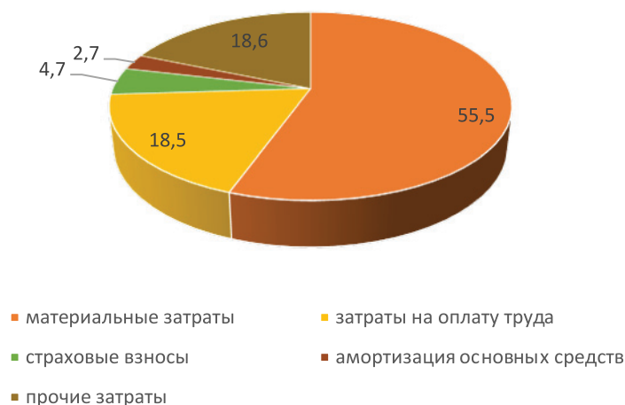
Рис. 3. Структура затрат на производство строительных работ в 2013 г., в %