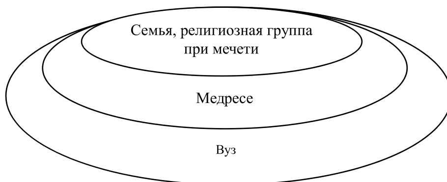
Рис. 2. Преемственность образовательных уровней исламского образования

ориентированного на срединный путь, предначертанный правилами и законами шариата, совершенствование личностных качеств, духовно-нравственного потенциала. Послевузовское исламское образование осуществляется через дополнительное образование, переподготовку и повышение квалификации. Ключевым фактором в этом процессе служит самовоспитание, саморазвитие, самореализация мусульман.