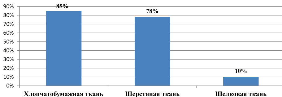
Рис. 2. Обеспеченность российского рынка тканью за счет отечественного производства