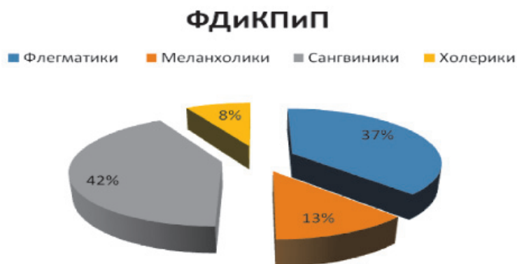
Рис. 3. Показатели типа темперамента студентов ФДиКПиП, n = 48