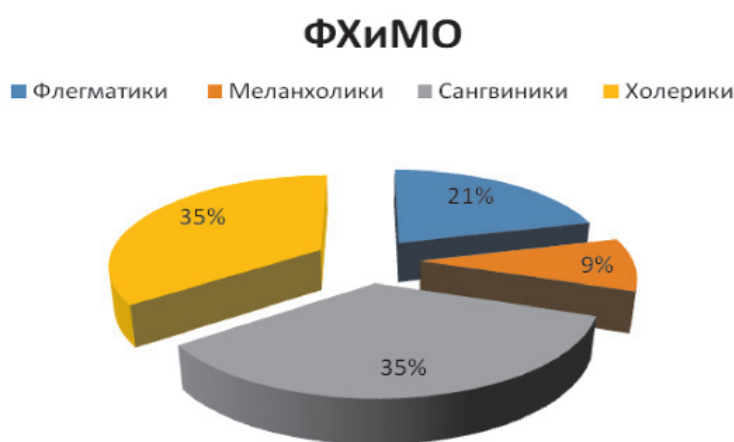
Рис. 4. Показатели типа темперамента студентов ФХиМО, n = 43

На факультетах ФМФ – 46 % (таблица), ППФ – 47 % (рис. 1), ТЭФ – 49 % (рис. 2), ФДиКПиП – 42 % (рис. 3) студентов с преобладанием сангвинического типа темперамента, а на факультете ХиМО (рис. 4) доминирующими выступают холерические и сангвинические типы темперамента студентов (по 35 %).