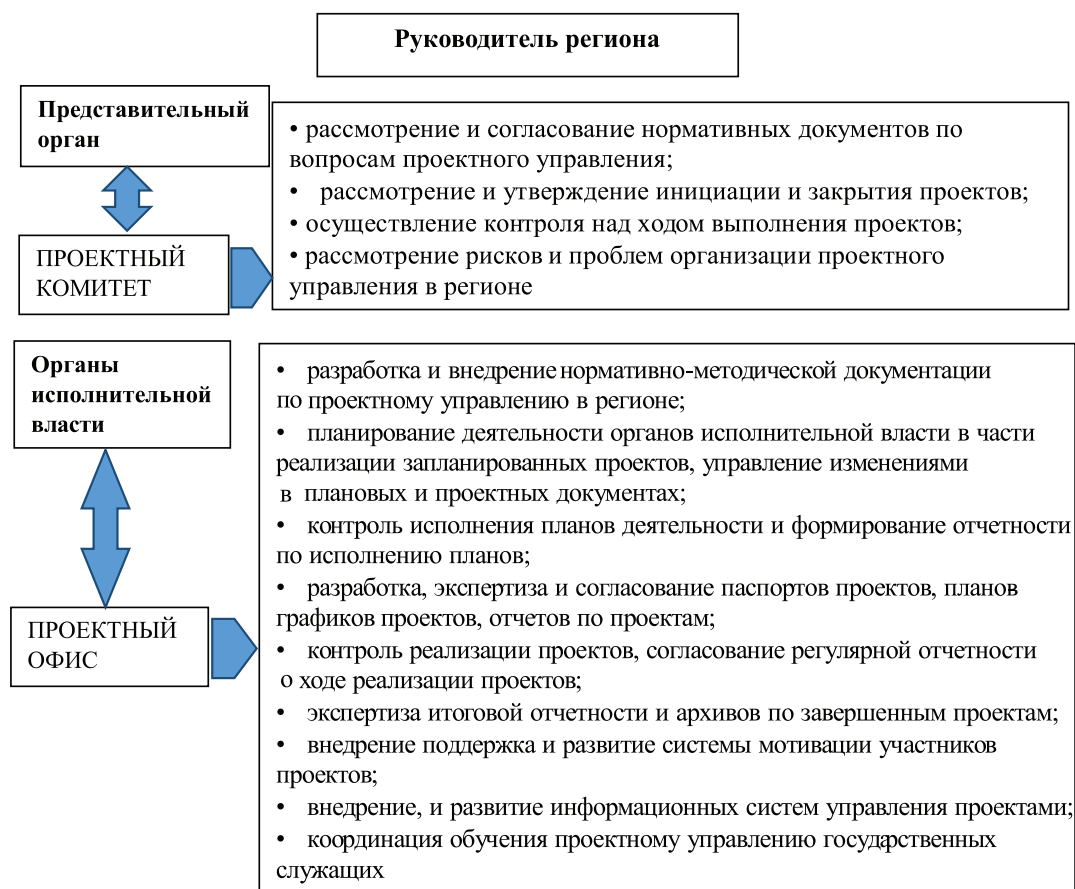
Рис. 3. Институциональная структура органов государственной власти региона для внедрения проектного управления [составлено автором с использованием 10]

На наш взгляд, проектный подход должен быть внедрен в практику реализации региональной политики в Северо-Кавказском федеральном округе. На уровне региональных администраций должны быть созданы проектные офисы, ответственные за разработку и реализацию проектов в экономике и социальной сфере.