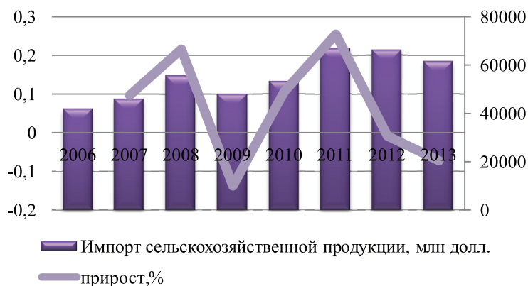
Рис. 1. Импорт сельскохозяйственной продукции, млн долл.

В ходе присоединения Японии к ТТП на внутренние рынки станет поступать дешевая импортная продукция, что негативно отразится на местных производителях. По прогнозам, оборот сельского хозяйства, оценивающийся сегодня в 7,1 трлн иен, упадет на 3 трлн иен из-за сокращения внутреннего производства. Японские эксперты уверены, что количество населения, занимающегося сельским хозяйством, снизится на 1,46 млн человек, а степень продовольственного самообеспечения Японии на 27% [8].