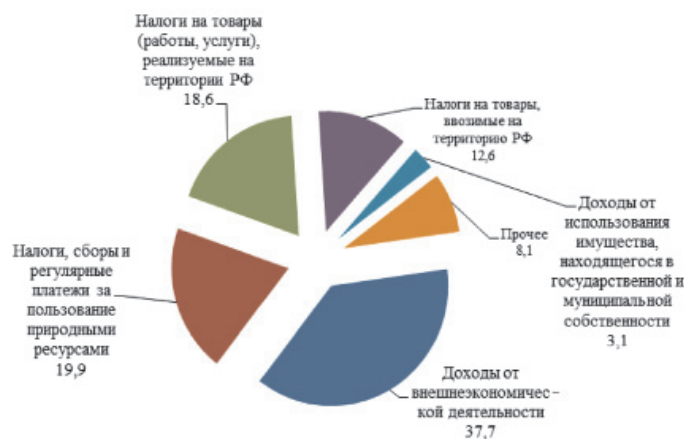
Рис. 3. Структура доходов федерального бюджета в 2014 году по видам доходных источников [5]

Наибольший удельный вес в структуре доходов представляют доходы от внешнеэкономической деятельности 5463,4–6,97 от ВВП.