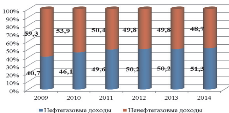
Рис. 2. Соотношение нефтегазовых и нефтегазовых доходов федерального бюджета Российской Федерации