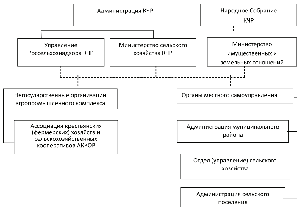
Рис. 2. Органы управления агропромышленным комплексом КЧР

Государственное управление агропромышленным комплексом осуществляет Министерство сельского хозяйства КЧР.