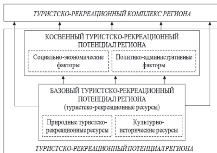
Рис. 1. Факторы формирования туристско-рекреационного потенциала региона

С ростом потребления, достижения им высоких значений, выше нормативных,