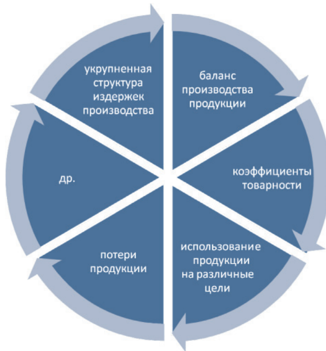
Рис. 3. Показатели, влияющие на продовольственные ресурсы [2]

Особенностью Северо-Кавказского региона является развитая инфраструктура рекреационного хозяйства: регион занимает третье место по объему сельскохозяйственного производства, уступая Приволжскому и Центральному федеральным округам.