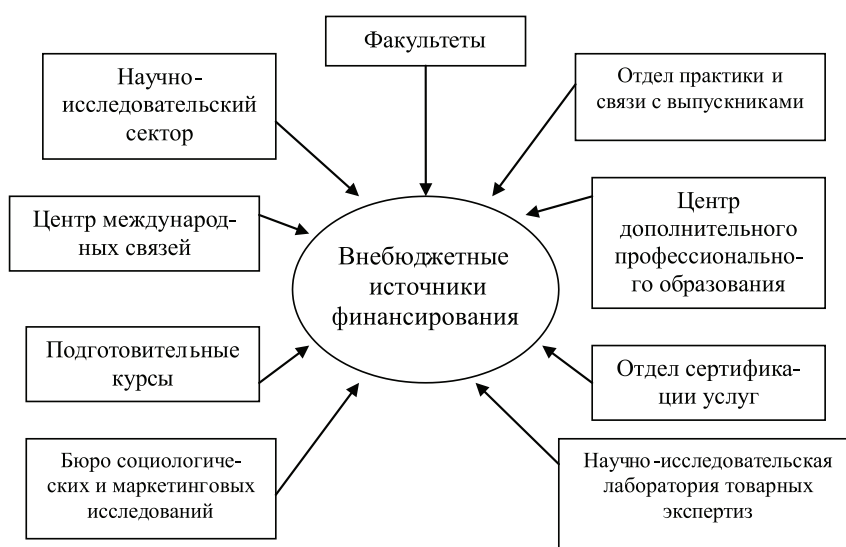
Рис. 3. Структурные подразделения, обеспечивающие внебюджетное финансирование института

сектора института. В настоящее время научно-исследовательским сектором проводятся исследования по следующим направлениям: фундаментально-поисковые исследования, прикладные исследования, разработка хоздоговорных тематик, участие в грантах, инициативные разработки. Изучив цены на аналогичные по объемам научно-исследовательские хозяйствующие договоры в разных регионах, отметим, что в центральных и периферийных вузах они разнопорядковые. Поэтому подходить к оценке эффективности деятельности и конкурентоспособности всех вузов с позиций столичных цен на одни и те же объемы исследований не представляется объективным.