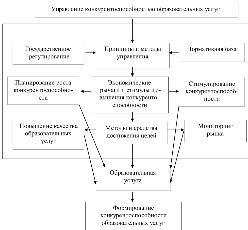
Рис. 2. Экономический механизм, обеспечивающий формирование конкурентоспособности образовательных услуг

находятся эти учреждения, в соответствии с государственными заданиями (контрольными цифрами приема) на подготовку специалистов, бакалавров и магистров.