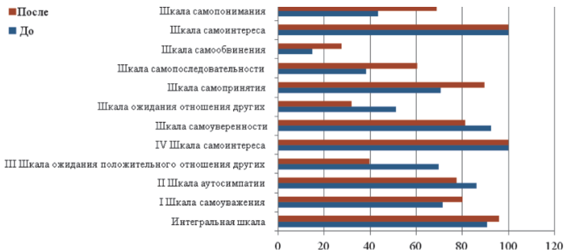
Рис. 3. Динамика изменения самооценки студентов экспериментальной группы

Результаты контрольного эксперимента показали, что общий уровень морального самосознания студентов, принимавших участие в эксперименте, возрос и характеризуется изменением структуры жизненных целей и социально-психологических установок в сторону уменьшения выраженности гедонистических, эгоистических