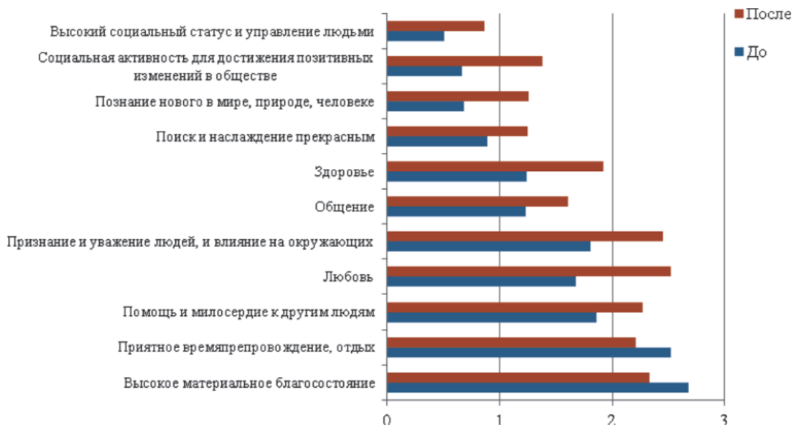
Рис. 2. Динамика изменения ценностных ориентаций студентов экспериментальной группы

самосознания. По методике межличностных отношений отмечается снижение авторитарности (до -8, после -5), агрессивности (5 и 4 соответственно), зависимости (8 и 6), подозрительности (6 и 5) и эгоистичности (10 и 2). Вместе с этим возрастают показатели альтруизма (3 и 7), дружелюбия (11 и 13) и подчиняемости (4 и 6).